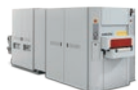
Viet Plast Narrow