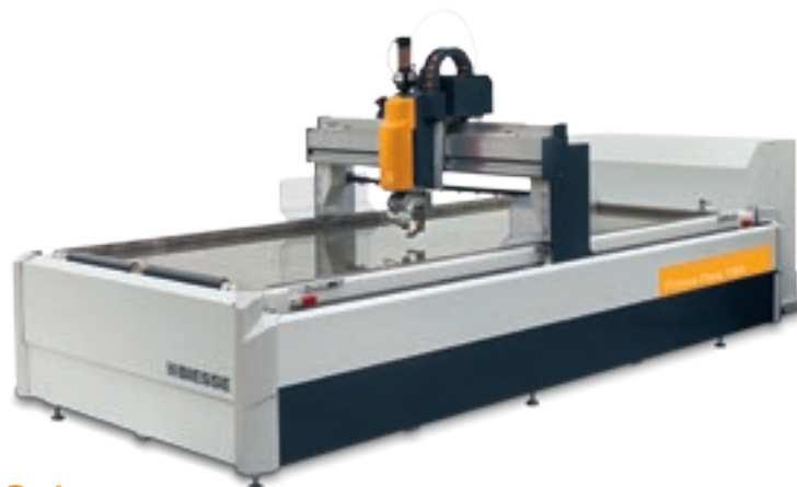
Primus Plast 184