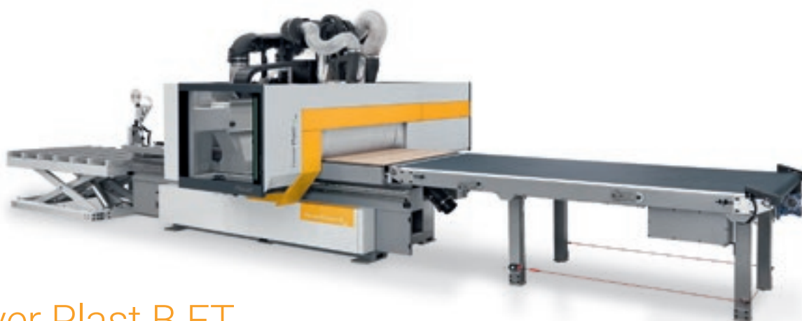
Rover Plast B FT