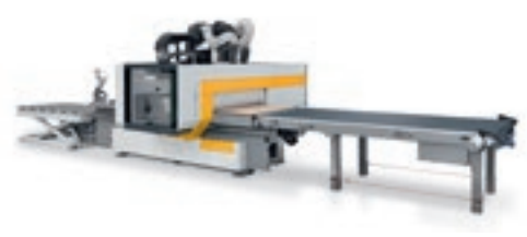
Rover Plast B FT