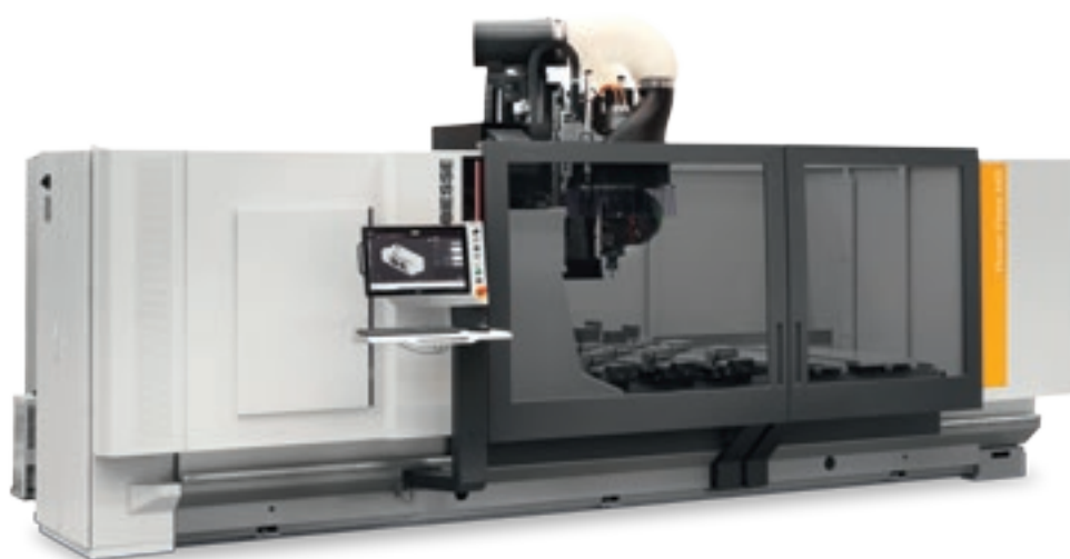
Rover Plast M5