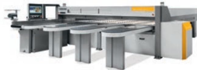
Selco Plast SK4

Selco Plast ist eine Baureihe von Plattenaufteilsägen mit einer Schnittlinie, die den unterschiedlichsten Produktionsansprüchen entspricht. Lösungen für die Erzeugung von Einzelwerkstücken, kleinen Serien und mittelgroßen Chargen.