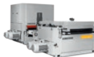
Viet Plast Valeria