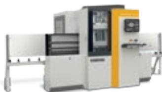
Brema Plast Eko 2.1