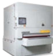
Viet Plast Opera 5-7-R