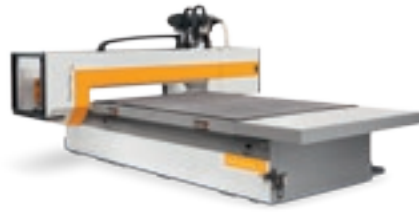
Rover Plast A FT