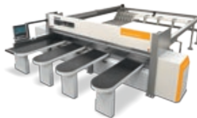
Selco Plast WN6