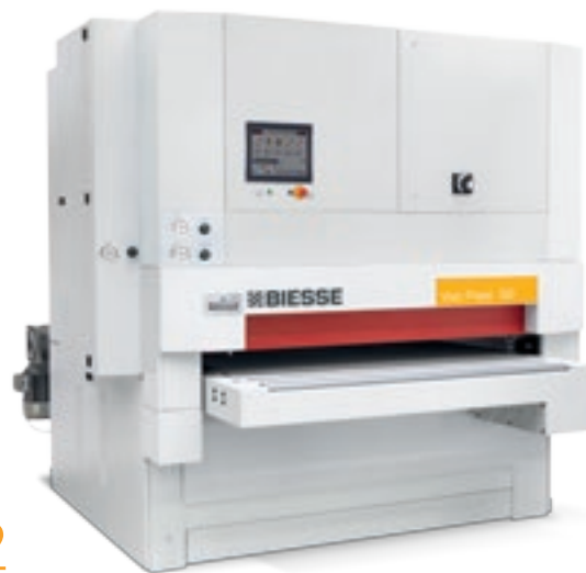
Viet Plast S211-S1-S2

Viet Plast ist die Schleifmaschinen Baureihe, die spezifische Lösungen zum Bearbeiten von Verbundmaterialien, Schaumstoffen oder kompakten Kunststoffen bietet. Große Auswahl an kombinierbaren und im Inneren der Maschine wiederholbaren Arbeitsgruppen zum Kalibrieren, Schleifen und Satinieren unterschiedlich großer Flächen.