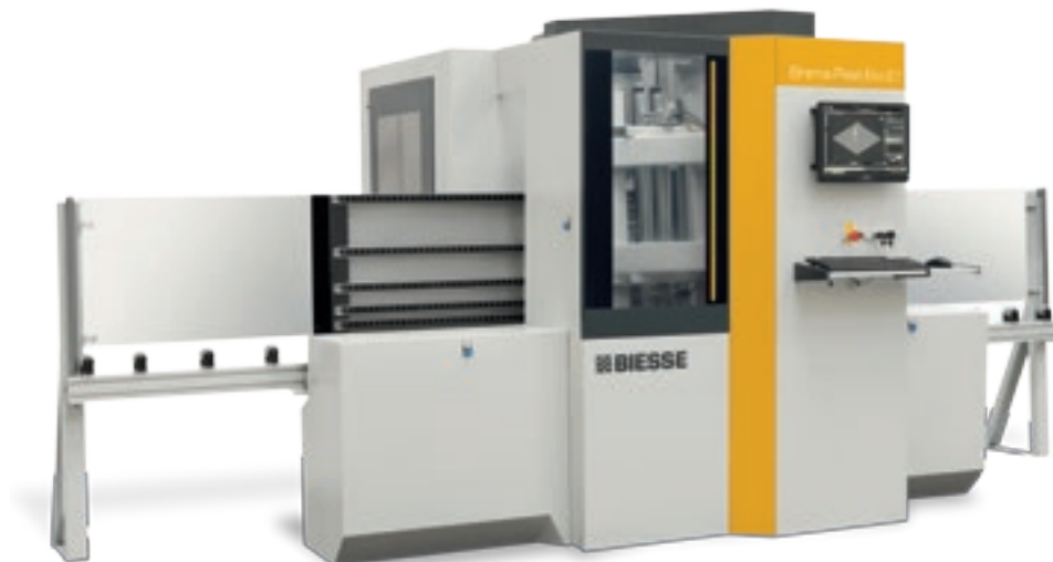
Brema Plast Eko 2.1

Brema Plast ist die Baureihe der vertikalen, patentierten, kompakten und vielseitigen Arbeitszentren, mit denen sich Formate mit unterschiedlicher Dicke und Abmessungen, technologische Kunststoffe und Verbundmaterialien bearbeiten lassen.