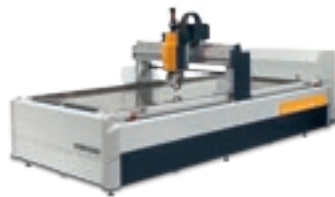
Primus Plast 184