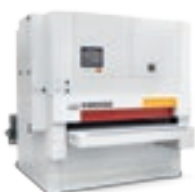
Viet Plast S211-S1-S2