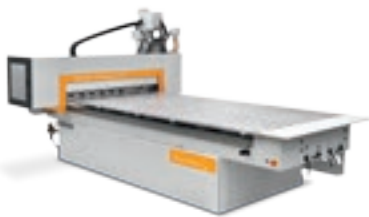
Rover Plast J FT