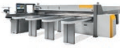
Selco Plast SK4