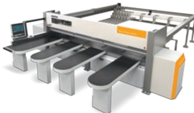
Selco Plast WN6