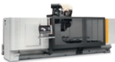
Rover Plast M5