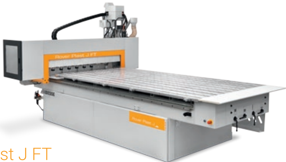
Rover Plast J FT

Rover Plast ist eine Baureihe von Arbeitszentren, die sich an den Handwerker und Klein- und Mittelbetriebe wendet und sich dank der innovativen spezifischen Entwicklungen für die Bearbeitung der technologischen Werkstoffe als äußerst zuverlässig und wettbewerbsfähig erweist.