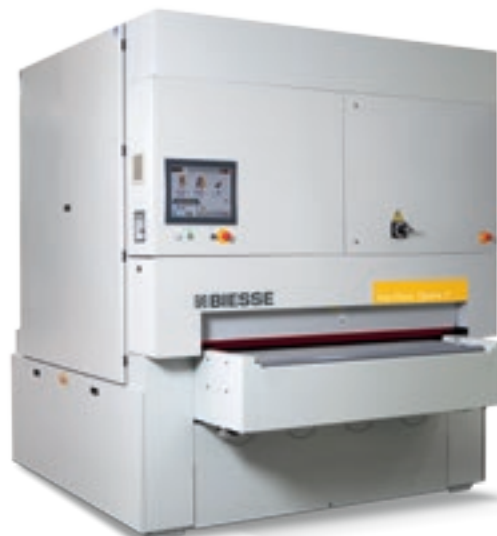
Viet Plast Opera 5-7-R