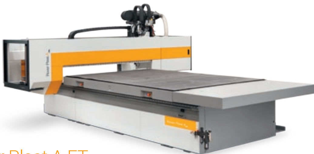
Rover Plast A FT