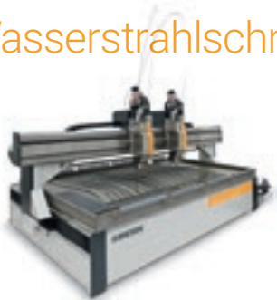
Primus Plast 202-322-324-326