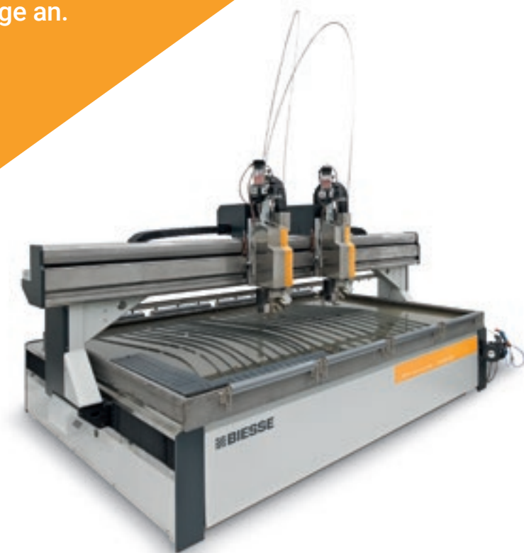
Primus Plast 202-322-324-326

Primus Plast ist die Waterjet-System Baureihe, die den Anforderungen von Unternehmen auf der Suche nach maximaler Vielseitigkeit bestens gerecht wird. Sie können jeden Materialtyp schneiden und passen sich problemlos jedem Produktionsgefüge an.